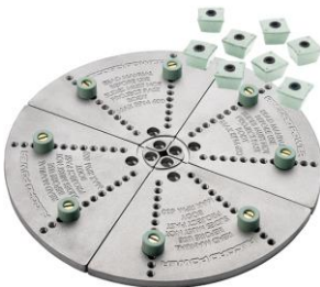
62 356 & 62 377