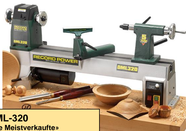
DML-320 «die Meistverkaufte» Preis: Fr. 822.00

Massive Gusskonstruktion und somit hohe Laufruhe, ab dem Einsteigermodell DML-250