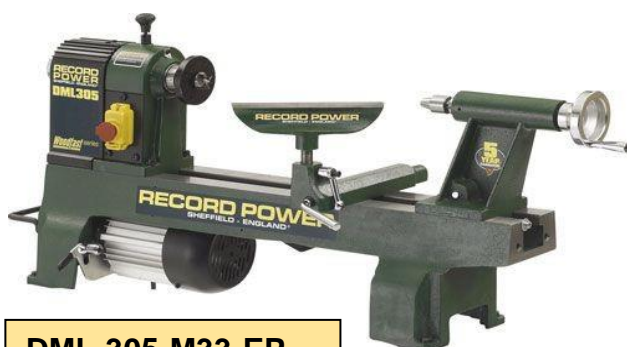
DML-305-M33-EP Preis: Fr. 451.00

Katalogpreis: Fr. 199.00 Aktionspreis: Fr. 169.00