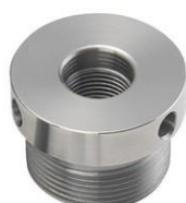
Gewinde-Einsatz für SC1 und SC4 Spannhalter (M33; M18, M20 etc.)

Weitere Spannbacken finden Sie auf der nachfolgenden Seite.