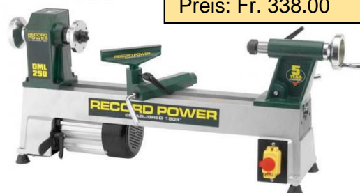
DML-250 «das Einsteigermodell» Preis: Fr. 338.00

Alle Preise inkl. 8,1 % MWST – Preis- & Modelländerungen vorbehalten, Juni 2024