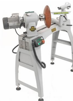
Coronet Envoy & Regent