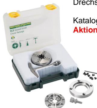
SC-3 Spannfutter-Set passend auf alle Recordpower Drechselbank-Modell

Katalogpreis: Fr. 199.00 Aktionspreis: Fr. 169.00